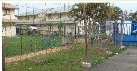
Chantier du mur : démolition de l'ancienne clôture et sécurisation de la zone de chantier. Merci de ne pas aller sur les zones de chantier !