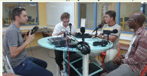
Emission webradio à l'occasion du forum des métiers, mercredi 8 février