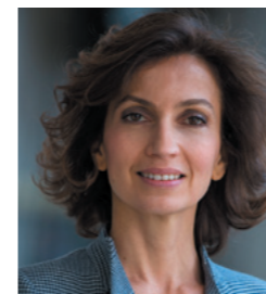
Audrey Azoulay ministre de la Culture et de la Communication

L'éducation artistique et culturelle n'est pas un domaine réservé. Ce n'est pas un luxe pour quelques privilégiés : c'est un bien commun, qui a vocation à être largement partagé. C'est une part essentielle dans l'apprentissage de l'autonomie d'un enfant, d'un adolescent, un élément clef dans sa formation en tant que personne et comme citoyen. Oui, l'éducation artistique et culturelle fait fond sur notre humanité, comme le rappelle Georges Steiner, lorsqu'il écrit que nous sommes, « un animal dont le souffle de vie est celui des rêves parlés, peints, sculptés et chantés » 1 . Cette conviction ne cesse de nous habiter et de nous porter au quotidien, et elle se traduit concrètement par la politique conjointe mise en œuvre par nos deux ministères en faveur de l'éducation artistique et culturelle.