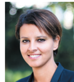
Najat Vallaud Belkacem ministre de l'Éducation Nationale, de l'Enseignement Supérieur et de la Recherche