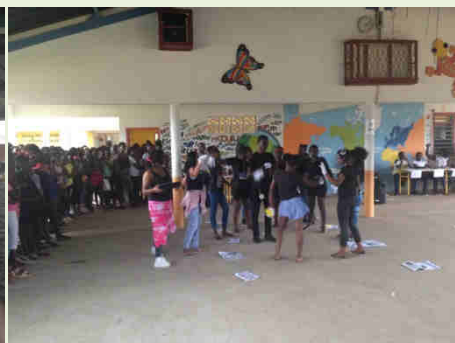
« Mon précieux » - Soprano