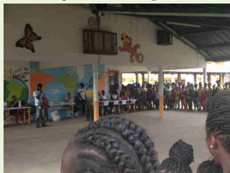
Concours de chants