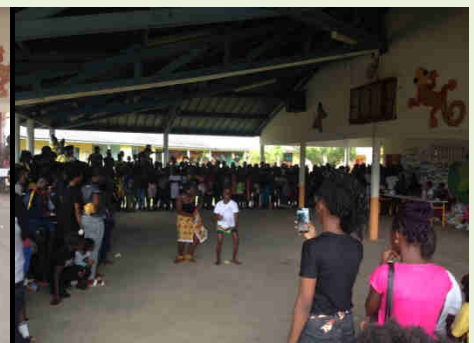
Sa mooï pangï

Merci à tous les élèves et à tous les personnels qui ont contribué à cette journée festive !