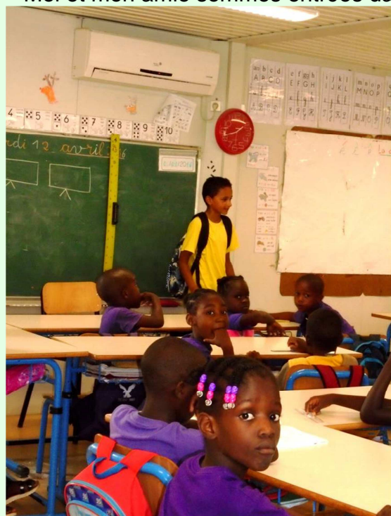
Les élèves de la 6 ème 8, Saint Laurent du Mar oni.