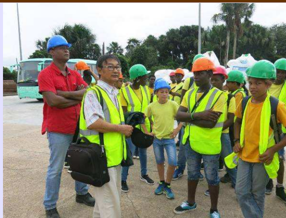
Les élèves ont semblé ravis.

Cette sortie était en accord total avec le cours sur le transport maritime, le fret, la mondialisation du commerce ainsi qu'un documentaire diffusé par France 5 (Les cargos, la face cachée du fret) et visionné par la classe.