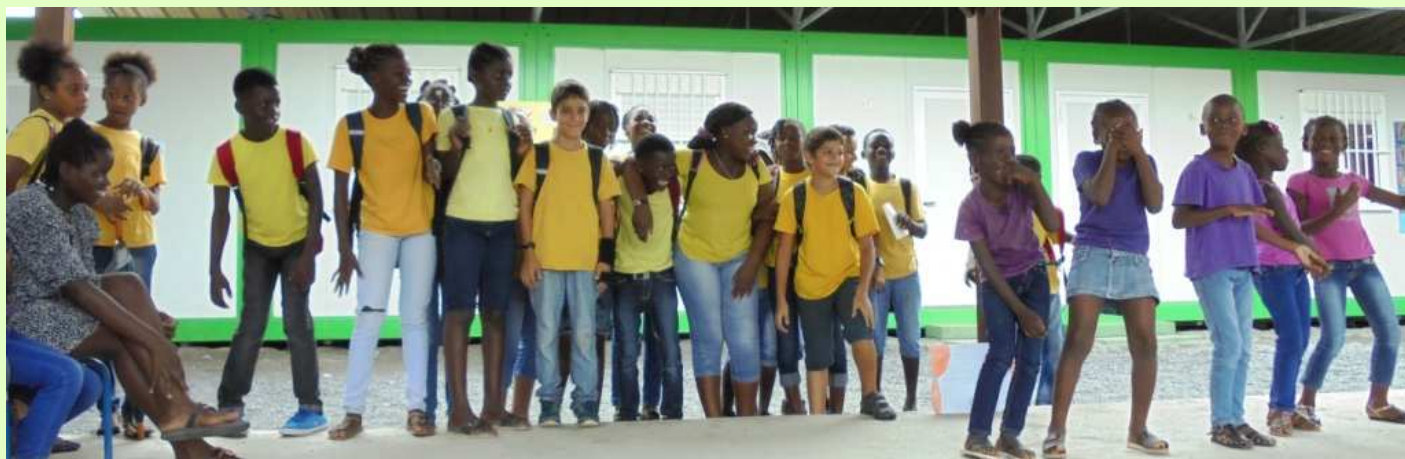
Morceaux choisis de textes d'élèves par Mme PAGÉ en pages 3 et 4.

La 6 ème 8, nous sommes à l'école P. Isnard.