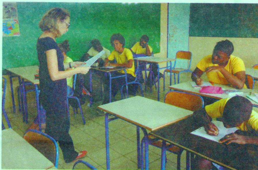
Des élèves d'une classe de 4 e du collège Albert-Londres, à Saint-Laurent, planchent sur cette dictée organisée pour la semaine de la langue française et de la francophonie. Une heure de dictée pour bien orthographier près de 300 mots : un véritable challenge pour tous

Ce texte, intitulé « Il court, il court, le chat futé » et comportant 291 mots, a été écrit par Michèle Friquémont. Il a été proposé par l'association France-Québec pour